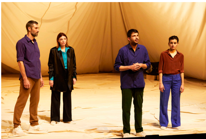
Les quatre comédien.ne.s pendant la générale du spectacle, à la Comédie.

La Comédie de Genève a le plaisir de vous présenter la création événement de cette saison 21-22 ; Dans la mesure de l'impossible , mise en scène par Tiago Rodrigues, du 1 er au 13 février 2022. Cette production Comédie inspirée par la Genève humanitaire est tirée d'entretiens avec des travailleurs de l'humanitaire, du Comité international de la Croix-Rouge (CICR) et de MSF – Médecins sans frontières, deux organisations dont le siège mondial est à Genève.